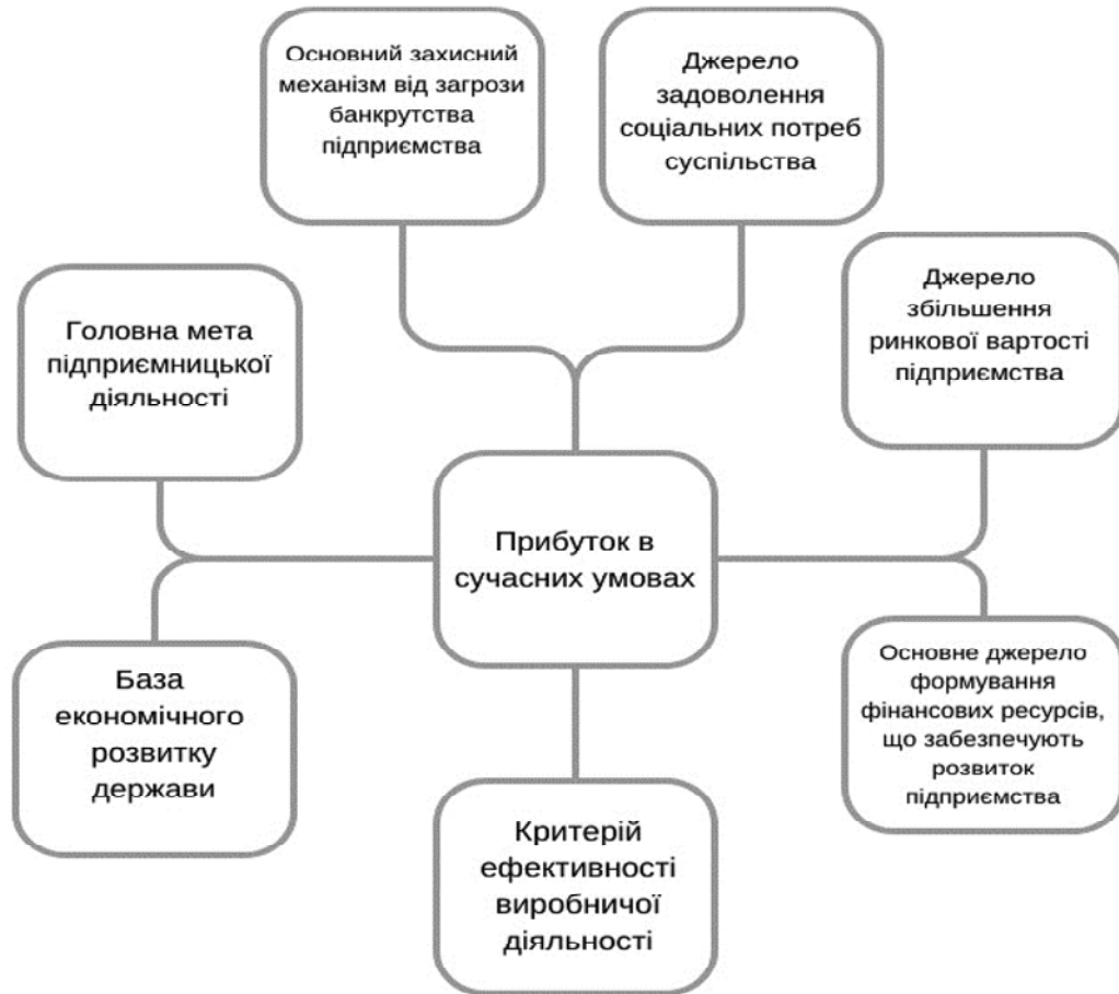
Рис. 1. Характеристика ролі прибутку в сучасних умовах діяльності підприємства