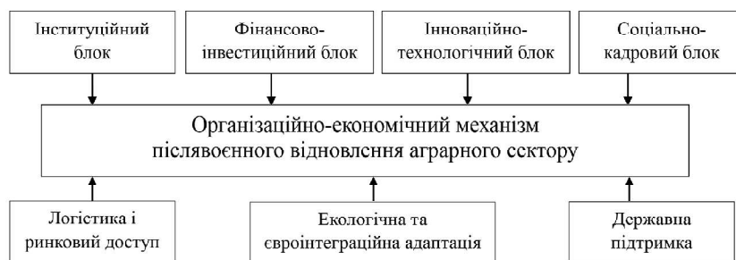
Рис. 1. Структурні елементи організаційно-економічного механізму післявоєнного відновлення аграрного сектору

Під впливом цих факторів відбулися суттєві зміни в організаційно-економічних механізмах функціонування аграрних підприємств. Якщо у довоєнний період переважали відносно стабільні форми стратегічного та оперативного управління, орієнтовані на традиційні канали фінансування й логістики, то в умовах воєнного часу аграрні підприємства були змушені переходити до більш гнучких моделей управління, диверсифікувати ринки збуту, шукати нові транспортні маршрути, перебудовувати фінансову політику, посилювати внутрішню адаптивність (рис. 2).