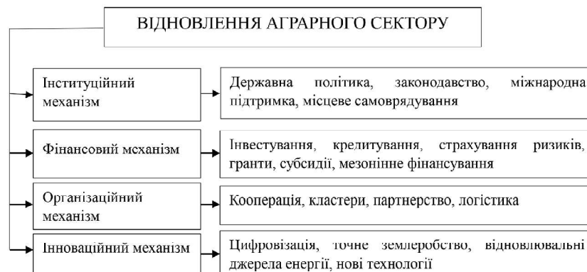
Рис. 2. Адаптація організаційно-економічного механізму стійкого розвитку аграрного сектору до сучасних викликів