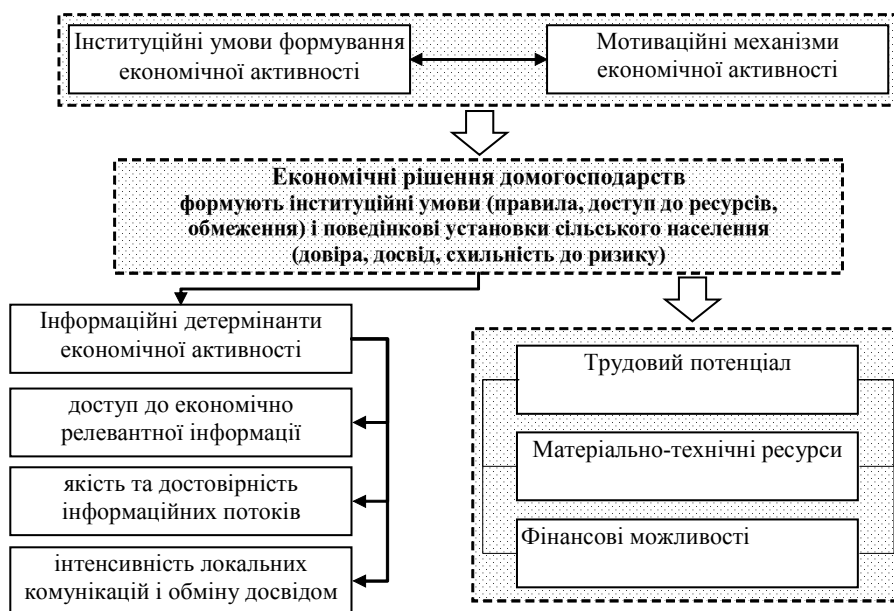
Рис. 2. Концептуальна модель взаємодії інституційних та поведінкових компонентів формування економічної активності сільського населення

Таким чином, приходимо до висновку, що економічна активність сільського населення