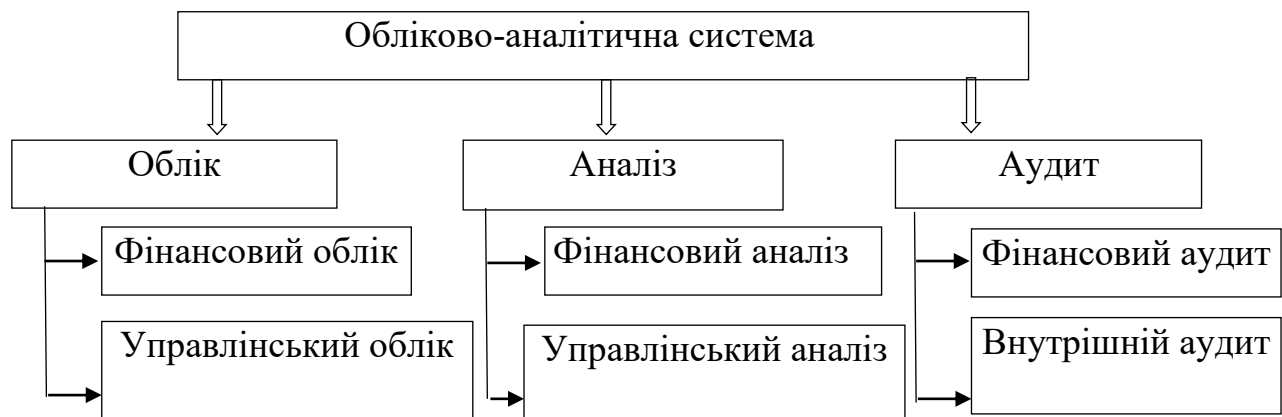
Рис.1. Елементи обліково-аналітичної системи інвестиційної безпеки підприємства [5]

Аналіз є проміжним етапом процесу управління між збором інформації і прийняттям рішень щодо оперативного регулювання виробництва і планування господарської діяльності економічних суб'єктів.