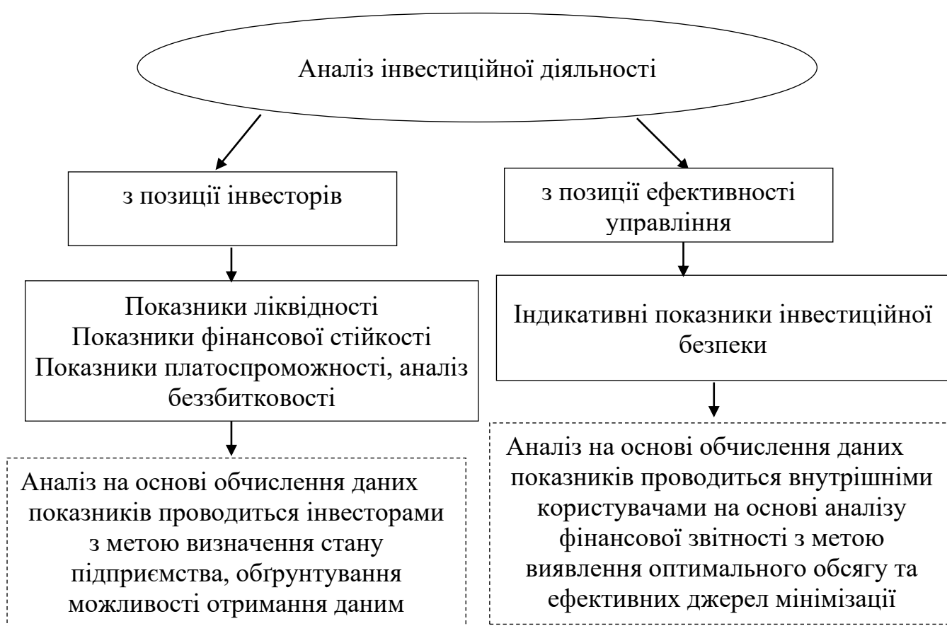
Рис. 3. Підходи до аналізу інвестиційної діяльності в частині забезпечення інвестиційної безпеки підприємства

Вважаємо, що аналіз інвестиційної діяльності в частині забезпечення інвестиційної безпеки можна розглядати з позиції інвесторів, а також з позиції ефективності управління процесами формування та використання інвестиційних ресурсів на рівні підприємства (рис. 3).