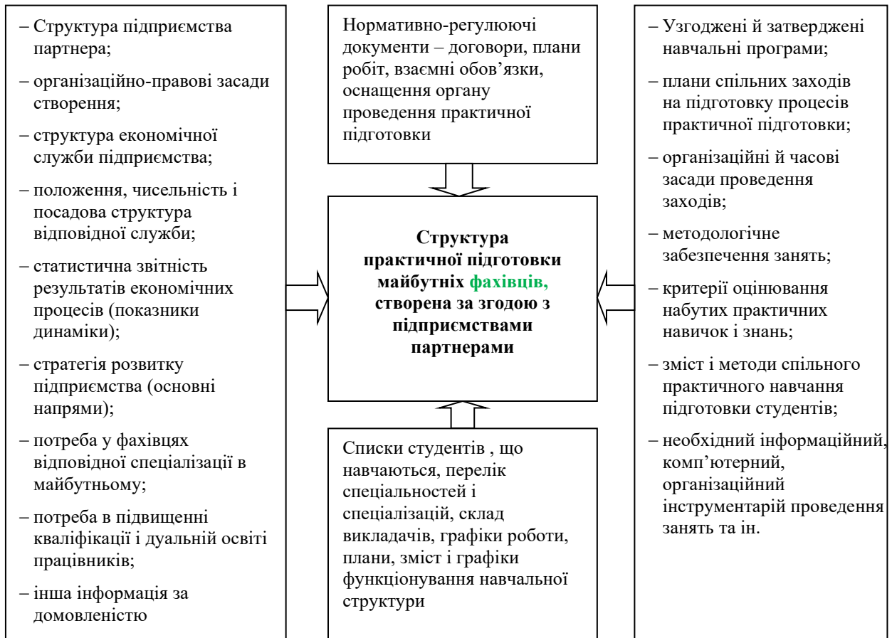
Рис. 1. Укрупнена структура інформаційного середовища спільного інституційного структурного підрозділу для практично-орієнтованого навчання студентів ЗВО

Процес організації співпраці партнерів повинен мати узгоджений зміст, спільну використовуєму і інтегровану структуру реалізації. Тому кожен його етап повинен бути узгодженим і спільно виконуємим. Схематично модель процесу представлена на рис. 2. Операції, описані в пунктах № 1–6, розробляємо представниками ЗВО і суб’єктів господарювання, здійснюються одночасно і паралельно узгоджуються. Подальші операції по проектуванню інтегрованого процесу проведення практичних занять (пункти № 7, 8, 9, 10) розробляються і виконуються спільно.