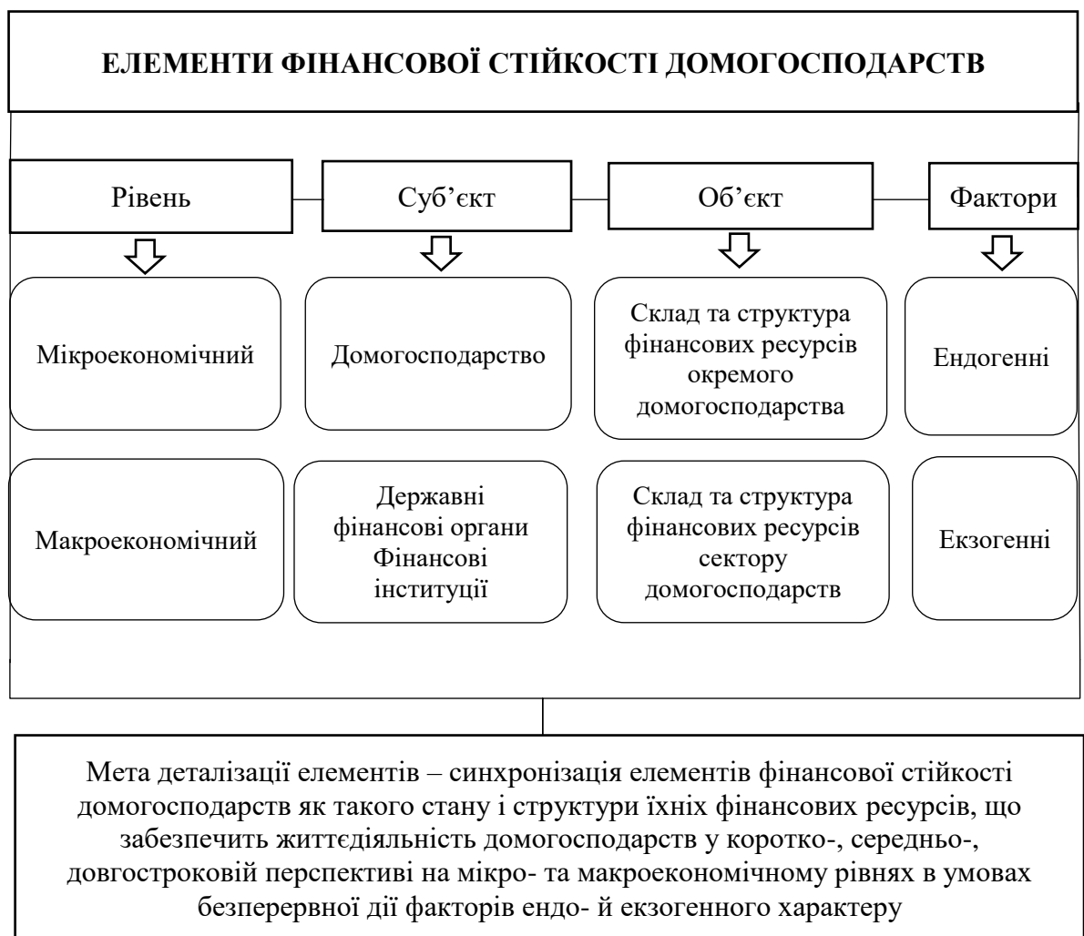
Рис. 1. Сутнісні елементи фінансової стійкості домогосподарств

Сутність фінансової стійкості, яку деталізують елементи її рівнів, суб'єктів, об'єктів та мети, зображені на рис. 1.