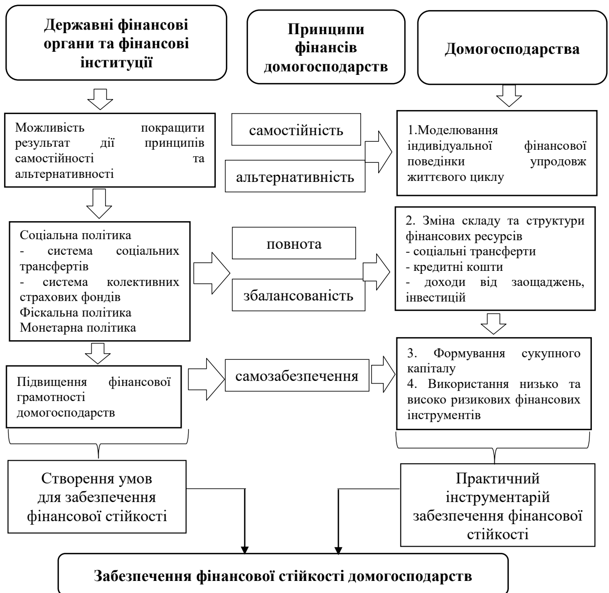
Рис. 3. Складові дуального забезпечення фінансової стійкості домогосподарств