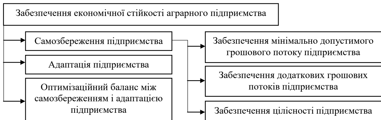
Рис. 2. Забезпечення економічної стійкості аграрного підприємства