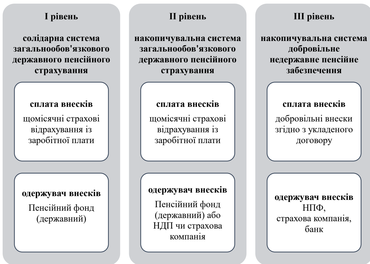
Рис. 1. Тривірнева система пенсійного забезпечення в Україні

Однак Україна формує класичну трирівневу пенсійну систему. Третій рівень створено у вигляді добровільного недержавного забезпечення за пенсійними схемами з певними внесками. Його основу становлять недержавні пенсійні фонди (НПФ), діяльність яких у країні поки що не можна назвати активною (рис. 1).