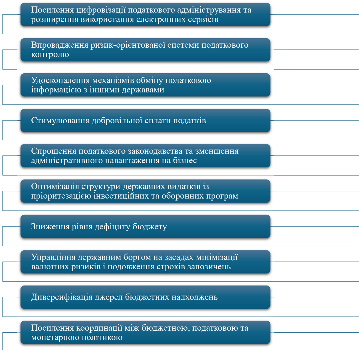
Рис. 3. Заходи щодо вдосконалення бюджетно-податкових відносин в Україні у категорії детінізації та фінансової безпеки