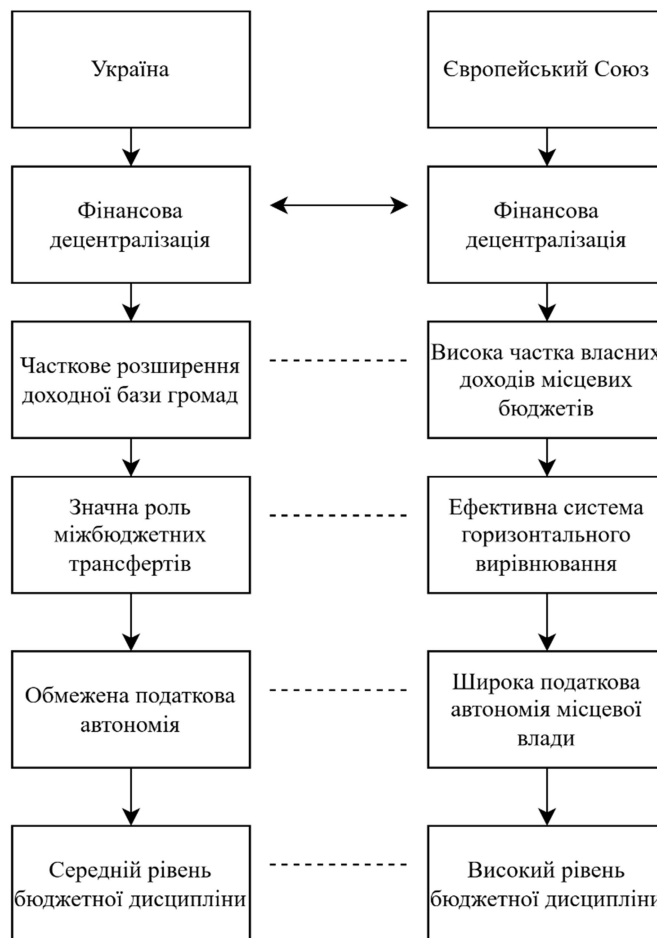
Рис. 2. Порівняльна модель фіскальної децентралізації (Україна – ЄС)