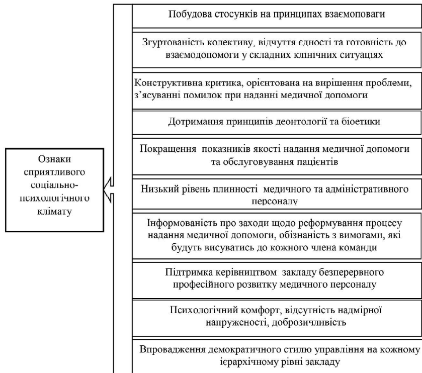
Рис. 2. Ознаки сприятливого соціально-психологічного клімату в колективі медичного закладу

персоналом та якість надання медичної допомоги. Основні ознаки сприятливого соціально-психологічного клімату представлено на рис. 2.