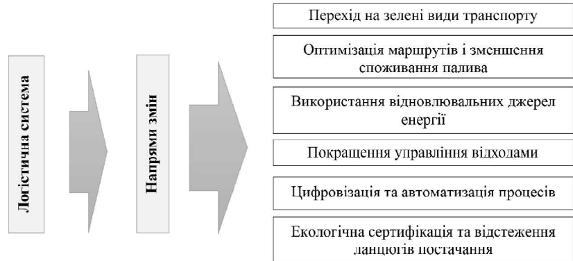
Рис. 3. Напрями змін логістичної системи в умовах зеленого переходу